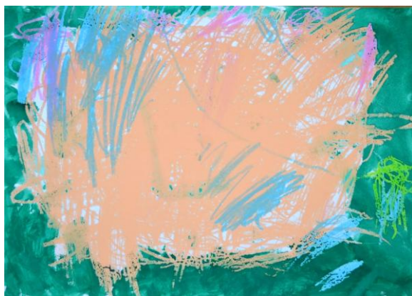
【あまざけととうにゅうのプリン おいしいからだいすき！】