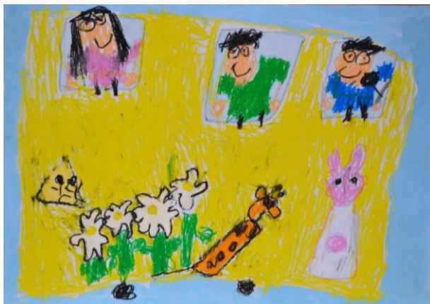
【やまわきさんと いんでいうと いよりと ミニバス】